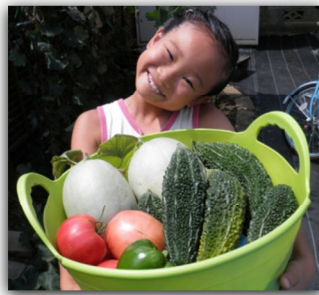
我家のゴーヤチャンプル

今年も我が家の家庭菜園では予想以上の収穫が出来ました。 モロコシ・枝豆・トマト・ゴーヤ・ピーマンは見事な出来栄えに大満足。 家計にも貢献出来たので嫁からも大絶賛。 なにより嬉しかったのがメロンの豊作です。 もったいないと思い、間引きはせずに数で勝負、甘さは今一でも沢山出来ました。 夕食ではゴーヤチャンプルをいただいた後にデザートは自家製メロン、なんとも贅沢な食卓でした。